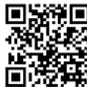
Bangkok Bank Mobile Banking QRコード